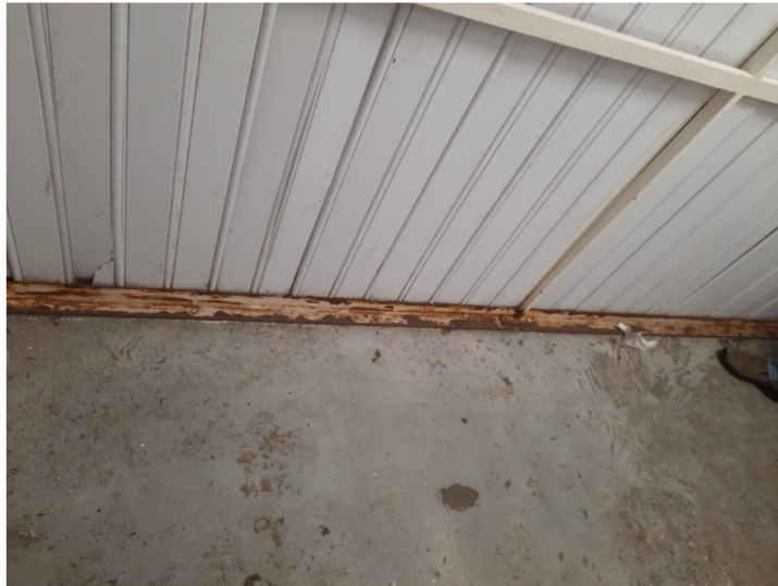
ESTRUCTURA METÁLICA EXISTENTE